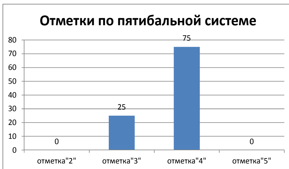
Рисунок 1. Распределение участников по группам в соответствии с полученными баллами.

Распределение обучающихся по группам в соответствии с полученными отметками по пятибалльной шкале представлено на рисунке 1.