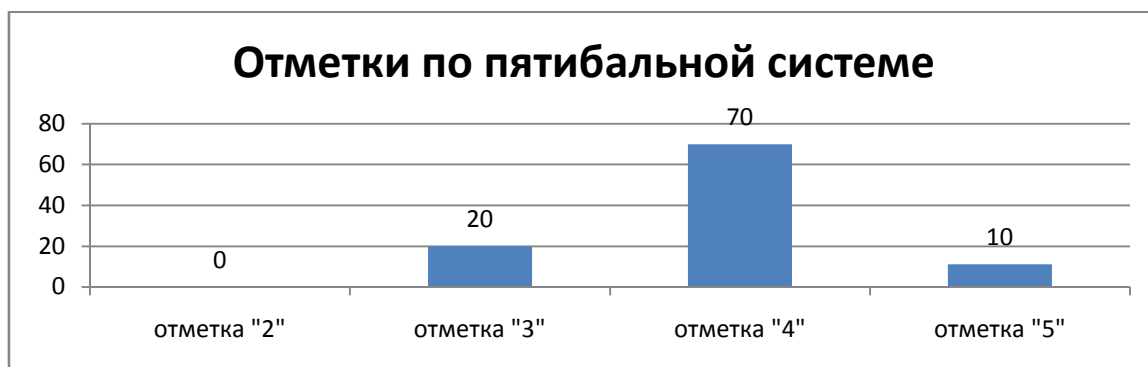
Рисунок 1. Распределение участников по группам в соответствии с полученными баллами

Распределение обучающихся по группам в соответствии с полученными отметками по пятибалльной шкале представлено на рисунке 1.