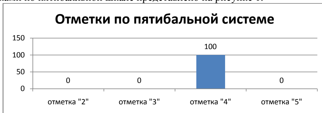
Рисунок 1. Распределение участников по группам в соответствии с полученными баллами

Распределение обучающихся по группам в соответствии с полученными отметками по пятибалльной шкале представлено на рисунке 1.