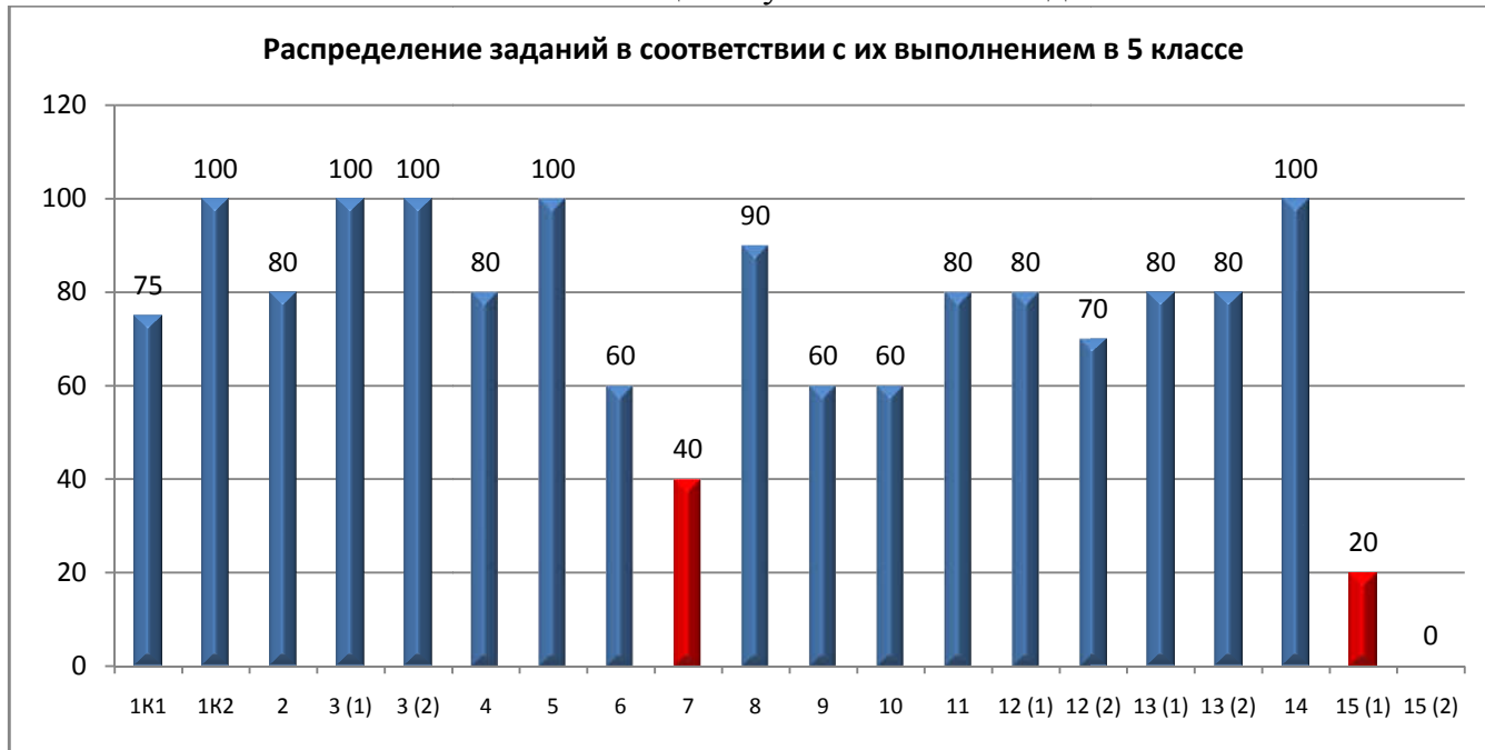
Распределение заданий в соответствии с их выполнением участниками

На рисунке 2 представлена гистограмма распределения заданий в соответствии с их выполнением пятиклассниками в общем и участниками в отдельности.