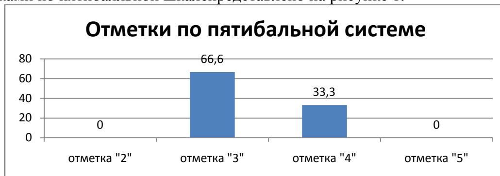
Рисунок 1. Распределение участников по группам в соответствии с полученными баллами

Распределение обучающихся по группам в соответствии с полученными отметками по пятибалльной шкале представлено на рисунке 1.